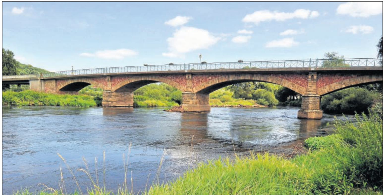
Das Wahrzeichen der Gemeinde: Erhaben schwingt sich die steinerne Fuldaabücke über den Fluss. Sie wurde im Jahr 1899 erreicht. Früher befand sich an dieser Stelle eine Furt.