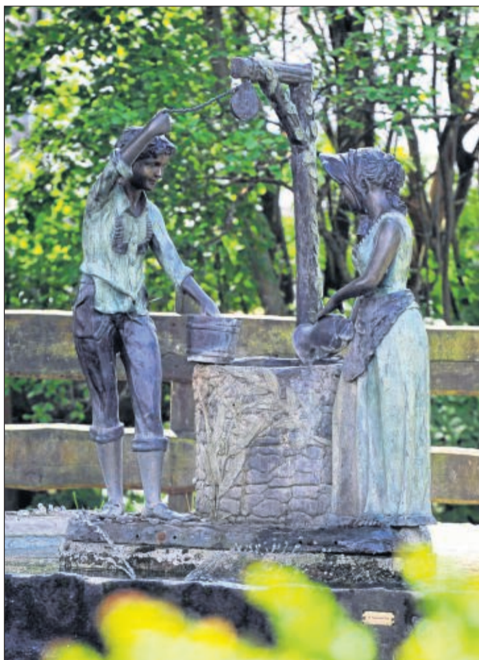
Der Dorfbrunnen mit „Leo und Lisa“ neben der alten Linde bildet den Mittelpunkt des Ortsteils Tann.