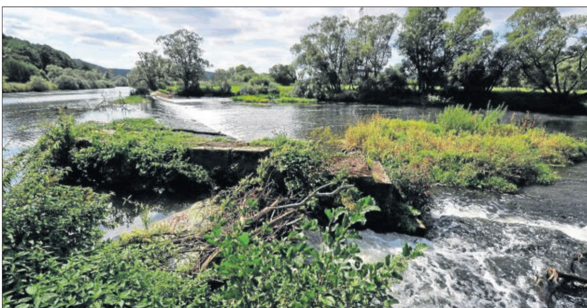
Intakte Flusslandschaft: Während andere Ströme des Landes längst in Betonbetten gezwängt wurden, kann die Fulda bei Ludwigsau frei und ungehindert durch die Landschaft plätschern.