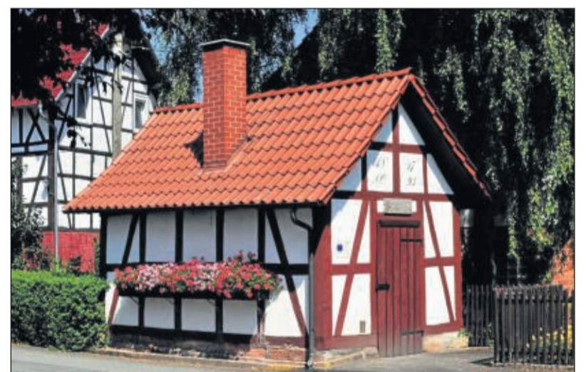
Putzig: Das kleine Backhaus im Herzen von Hainrode ist immer noch in Betrieb und bildet den Mittelpunkt des kleinsten Ortsteils von Ludwigsau.

Die Regional-Kalender der Hersfelder Zeitung und der Sparkasse Bad Hersfeld-Rotenburg mit Fotos von Ludger Konopka gibt es für nur fünf Euro in allen Sparkassenfilialen und im Verlagshaus der Hersfelder Zeitung am Benno-Schilder-Platz 2 in Bad Hersfeld solange der Vorrat reicht.